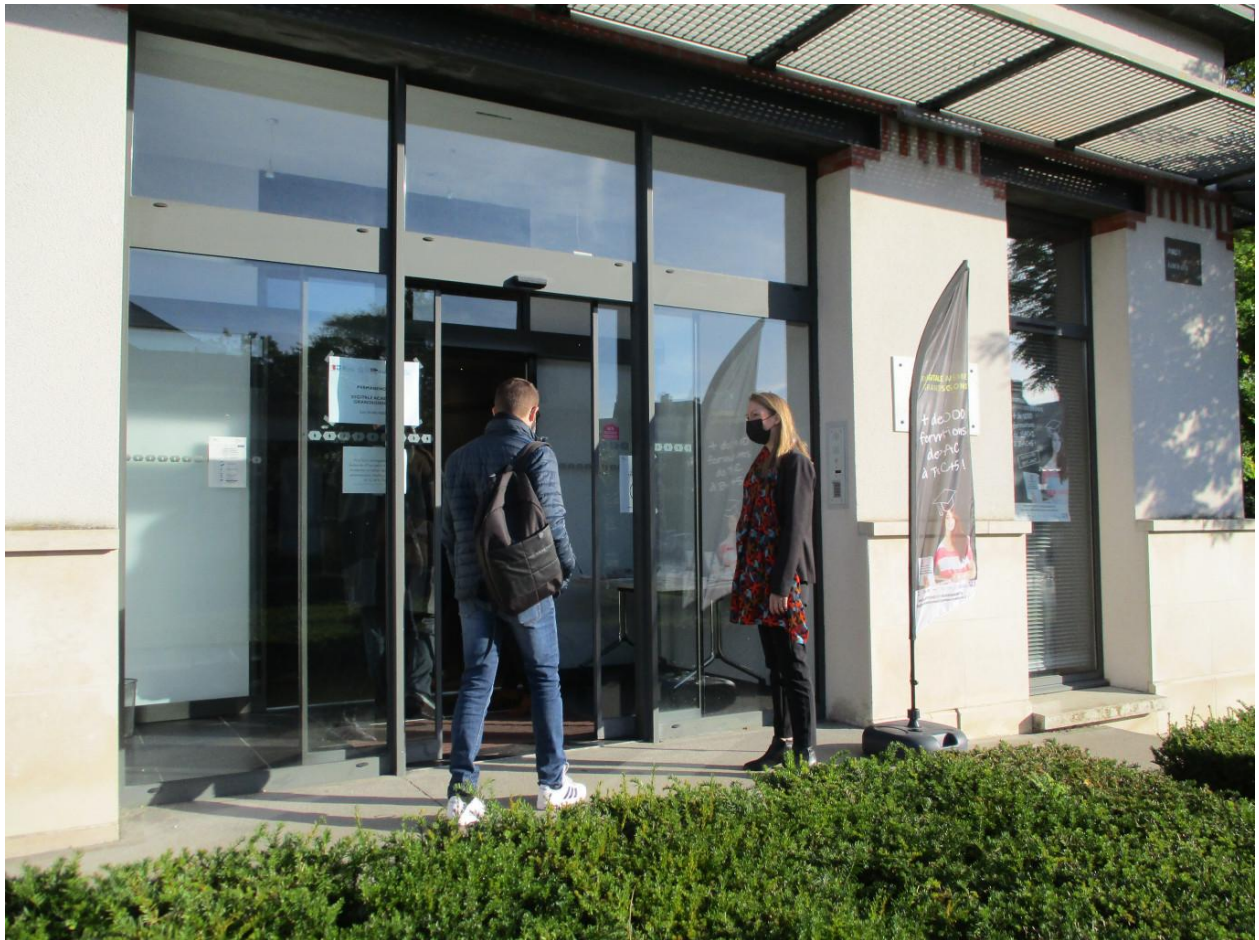
La Digitale Académie a pris ses quartiers au Parc Gouraud, dans un bâtiment situé à l'entrée du site.

La première promotion de la Digitale Académie a fait sa rentrée dans des locaux flambant neufs aménagés dans le bâtiment situé à l'entrée du Parc Gouraud à Soissons. Relayée localement par les structures spécialisées dans l'insertion des jeunes, l'information a circulé et le concept de la Digitale Académie a séduit une vingtaine de jeunes du territoire qui ont fait leur rentrée. « Ce dispositif de formation permet à des jeunes du territoire de rester étudier sur leur territoire d'origine auquel ils sont attachés. La Digitale Académie regroupe en un lieu unique des étudiants suivant des cursus variés qui bénéficient d'un accompagnement personnalisé. Ils peuvent bénéficier d'une plate-forme d'enseignement connectée de plus de 1 000 formations en ligne. Ce dispositif leur permet d'aménager leur temps d'étude », explique Michel Gobillot, président d'Alméa Formations Interpro, très satisfait d'étendre le rayonnement de l'association implantée en région Champagne-Ardenne à la région Hauts-de-France. Le président de la Communauté d'agglomération, Alain